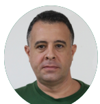
Diretoria de Ação Institucional Tércio Sobral Cavalcante Leite Fortaleza (CE)