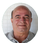
Diretoria de Previdência e Saúde José Carlos Cabral Aracaju (SE)