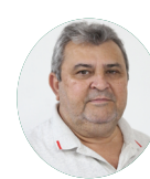
Secretário José do Egito Parnaíba (PI)