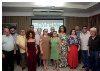
Posse da Diretoria e Conselho Fiscal