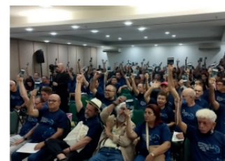
60ª Reunião do Conselho de Representantes